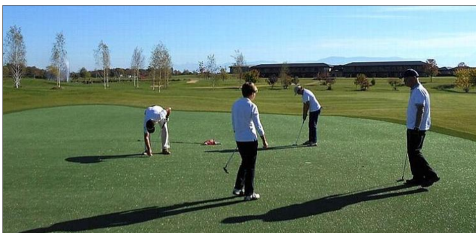
Le site du golf du Jiva Hill comprend aussi une base de ski nautique de niveau mondial, un hôtel 5*, un restaurant gastro, un Spa, deux courts de tennis, un parcours de santé et un hélicoptère.

Prochain grand rendez-vous la Beaujolais Cup, le 22 novembre.