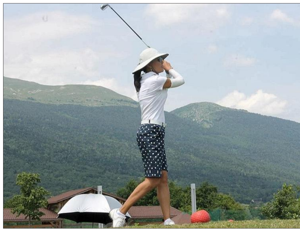
Il existe six golfs dans le Pays de Gex, contre 16 dans tout le département de l'Ain. Dans les clubs du Pays de Gex, on trouve une majorité de Suisses parmi les membres.